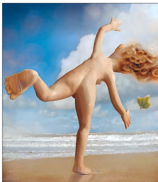
PLASTILINA: «Eva på stranden» er et av flere bilder som er en kombinasjon av plastilina, maleri og foto.